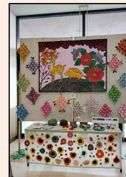
作品展 (通所リハビリ)